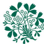
Royal Botanic Garden Edinburgh

Au nom du Jardin botanique royal d'Édimbourg