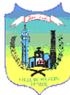
Commune De M'saken