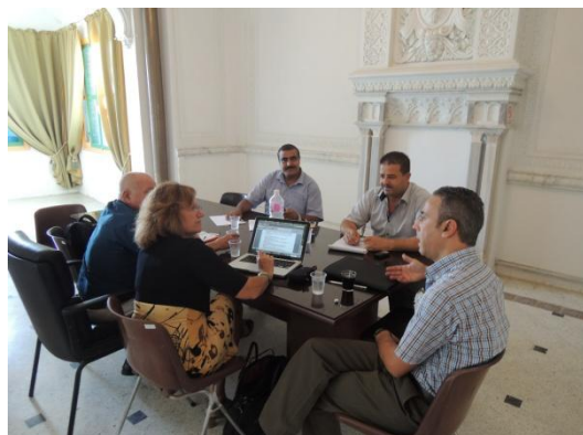
Troisième mission technique de Marseille à Sousse. 6 Octobre, 2014

Les municipalités de Marseille et de Sousse ont élaboré un projet commun pour travailler sur l'éclairage public et l'économie d'énergie. Marseille coopère également de manière active avec Al Fayhaa à plusieurs projets.