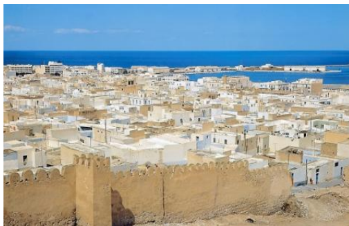
Medina de Sousse

Après l'expérience réussie avec la mise à jour et l'établissement d'un système de contrôle du PCD de Tétouan, AERYC et l'Aire Métropolitaine de Barcelone, faisant fonction de Secrétariat Général de MedCités, ont présenté une nouvelle proposition de projet pour développer un projet similaire à Sousse.