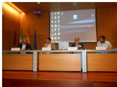
Signature de l'Accord de Coopération avec la plateforme CAT-MED. Málaga 15 Septembre 2014

MedCités a entamé un processus pour formaliser la coopération à long terme qui existe avec plusieurs institutions travaillant sur la coopération méditerranéenne. Le nouveau site Web de MedCités a une section sur l'Alliance Stratégique pour donner la possibilité à nos partenaires d'accroître la visibilité de leurs actions. Trois Alliés Stratégiques ont été inclus dans le site Web au cours de l'année dernière, à savoir la Commission Méditerranée de Cités et