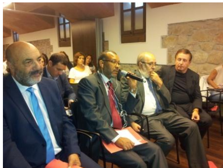
Visite d'échange et formation de la délégation du Plan Communal de Développement de Tétouan. Barcelone, 13-14 Octobre 2014

La mission finale de ce projet a été développée les 4 et 5 novembre 2014. Le projet a été financé par le Conseil provincial de Barcelone.