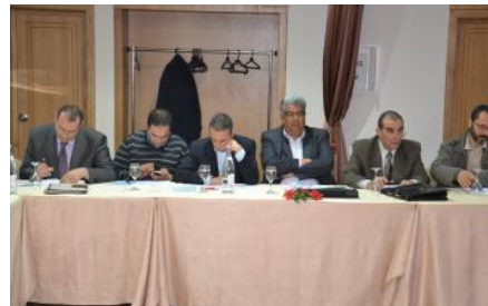
Session de formation de la diffusion des stratégies de développement urbain pour les villes tunisiennes, organisé par le CTC Sfax. 27 février 2014

Le CTC a embauché un consultant pour élaborer un projet afin d'étendre le projet USUDS à d'autres villes tunisiennes, y compris la création de l'Office de Développement Local de Sousse et de Sfax et de renforcer le rôle de Sfax comme CTC. Le résultat est le projet ESDEVET (Extension des Stratégies de Développement des Villes en Tunisie). 8 villes tunisiennes ont exprimé leur intérêt à participer : Gabès, Mahdia, Djerba, Monastir, Nabeul, Gafsa, Kairouan et Bizerte.