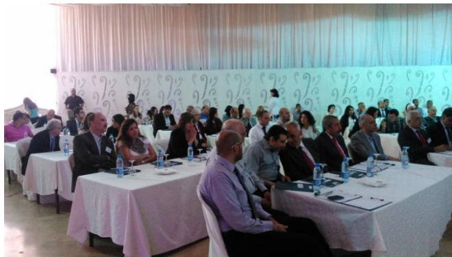
Séminaire sur la diffusion de la planification stratégique en Mashreq, organisé par le KTC Alfayhaa. Tripoli, 26 Juin 2014.

Enfin, Malaga continue de fonctionner comme un Centre de Transfert des Connaissances pour la méthodologie et les Bonnes Pratiques, sis à la Fondation CIEDES, avec le soutien du Secrétariat Général de MedCités.