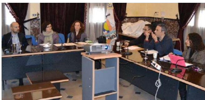
Première mission de la Municipalité de Barcelone à Sousse. 26-29 Janvier , 2014

La municipalité de Barcelone a fourni une assistance technique aux villes de Sousse, sur la gestion du cycle de l'eau, et à la ville de Saïda, sur la reformulation du port de pêche.