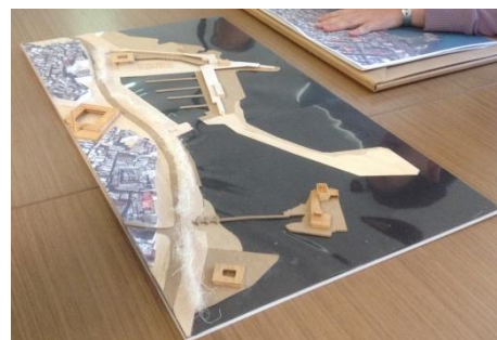
Proposition de la reformulation du port de pêcheur et la Corniche de Saïda, par la Municipalité de Barcelone

À la suite de ces aides, Barcelone et Saïda travaillent sur la signature d'un Protocole d'Accord. Barcelone a également signé un accord de coopération avec la ville de Tétouan.