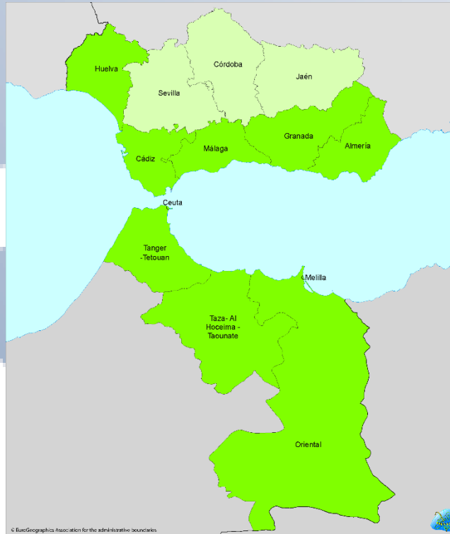
Geographical Eligibility ENPI CBC 2007-2013 Crossborder Cooperation Spain/Morocco

POCTEFEX (Cooperación Territorial Europea)